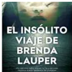
El insólito viaje de Brenda Lauper