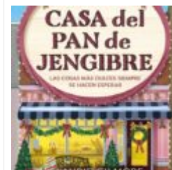
La casa del pan de jengibre